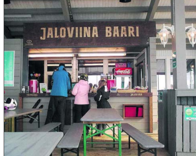
Tästä SkiBistron palo alkoi.