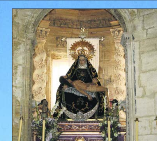
Montefrío on ollut alttarina monissa japanilaisissa häissä.

Kalastajan toivepaikka 365 päivää vuodessa on Riofrío. Kristallinkirkas joki antaa nimen kylälle, jonne granadalaiset tulevat syömään alueen kuuluu taimenta.